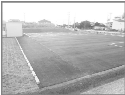
バス回転場移設工事(新設) 【平成29年11月完了】