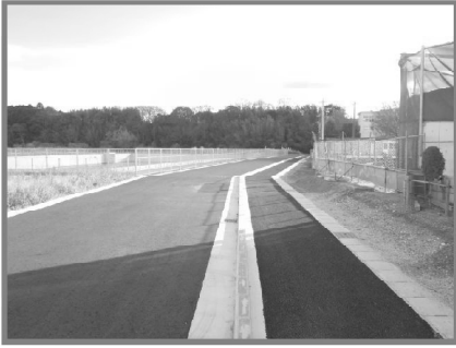
第7期区画道路(H28から繰越) 【平成29年5月完了】