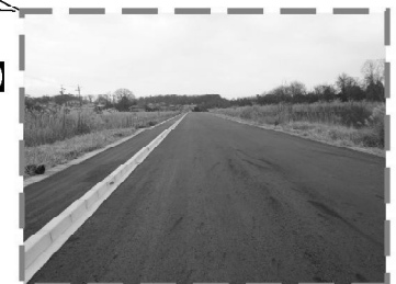
下志段味線(暫定形) 【平成29年11月契約・施工中】