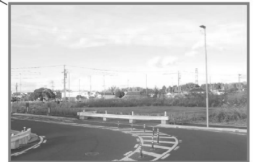
バス回転場移設工事(旧回転場撤去) 【平成29年12月完了】