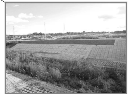
野添川護岸(H28から繰越) 【平成29年5月完了】