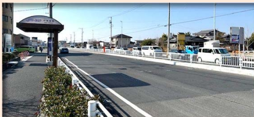
④【志段味田代町線道路築造工事】