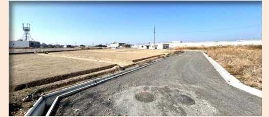
①【区画道路築造等工事】