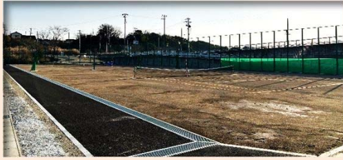
③【愛知県立守山高校機能補償工事】