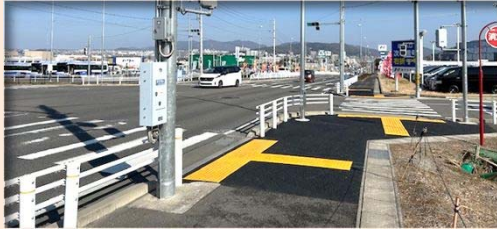
⑤【志段味田代町線補修工事】