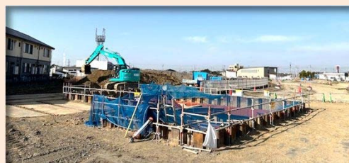
②【3号調整池築造工事】