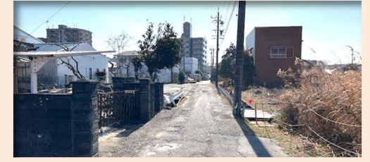
⑦【第24期水路築造工事】