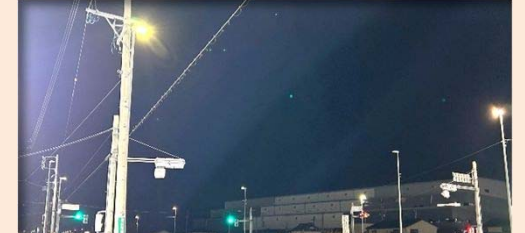
⑥【志段味田代町線照明工事】